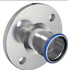
Imagen de ejemplo